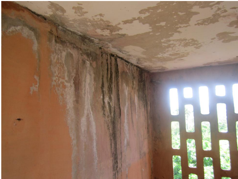
Moho en las paredes aledañas a las escaleras del edificio