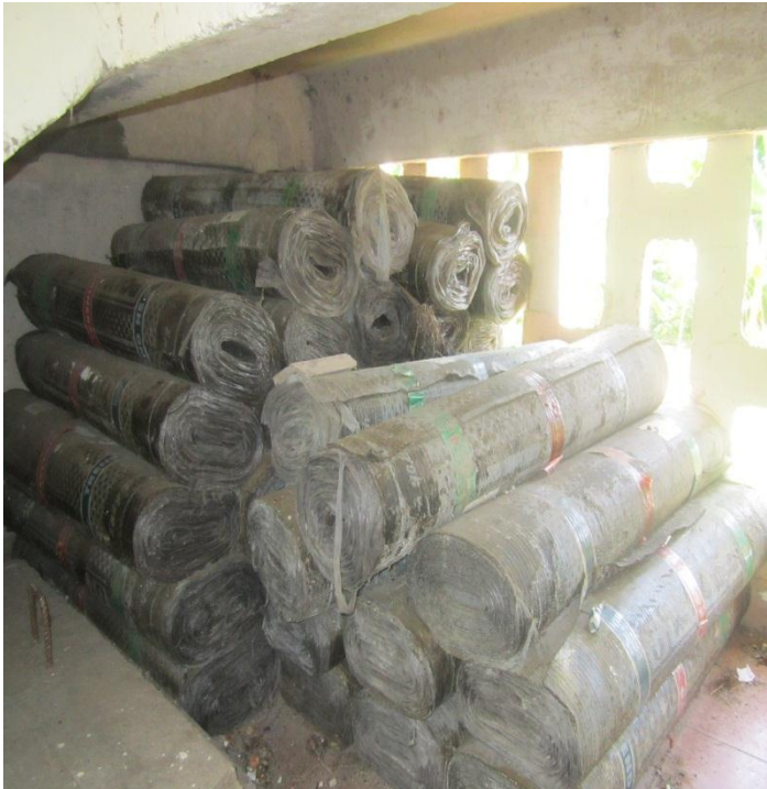
Materiales impermeables para la reparación de la cubierta colocados debajo de uno de los pasos de escalera del edificio.

Evidenciándose insatisfacción por la atención recibida por el gobierno, ante las quejas formuladas, muchos se sienten engañados por el aplazamiento de la solución de reparación, aun cuando los materiales y mano de obra existen, y que meses atrás se dio por concluida la reparación, otros se sienten inconformes con la calidad del servicio prestado, pues ya presentan paredes manchadas, salideros en la instalación de agua y paredes descoloridas.