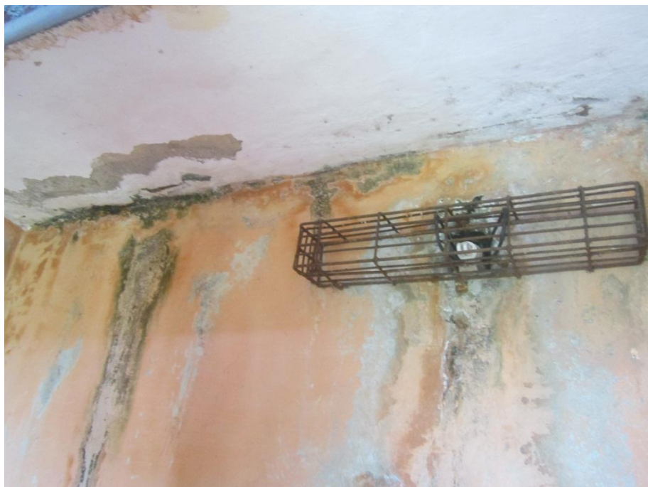
Filtraciones en las instalaciones de alumbrado del edificio.