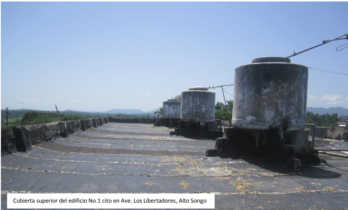
Cubierta superior del edificio No.1 cito en Ave. Los Libertadores, Alto Songo

TÍTULO: DEFICIENTE REPARACIÓN DE LA CUBIERTA DE UNO DE LOS EDIFICIOS MULTIFAMILIARES DE ALTO SONGO, QUE MANTIENE A LOS VECINOS DEL INMUEBLE VIVIENDO CON SERIOS PROBLEMAS DE FILTRACIÓN Y HUMEDAD.