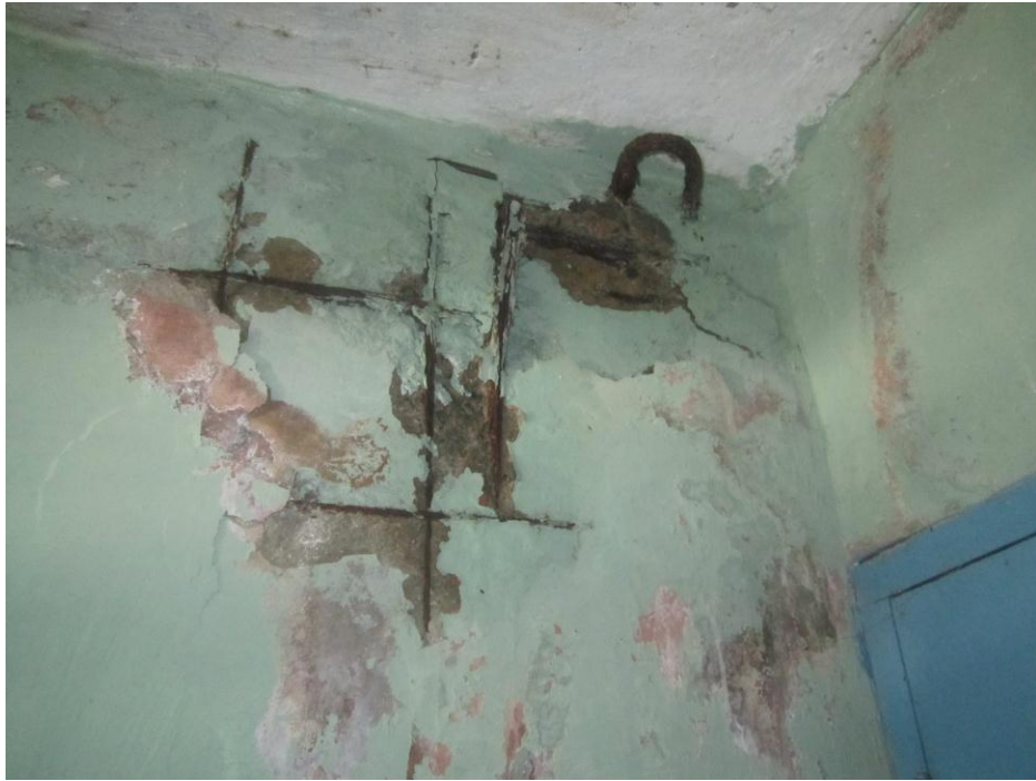
Corrosión del acero dentro de las paredes producto de las filtraciones de agua.