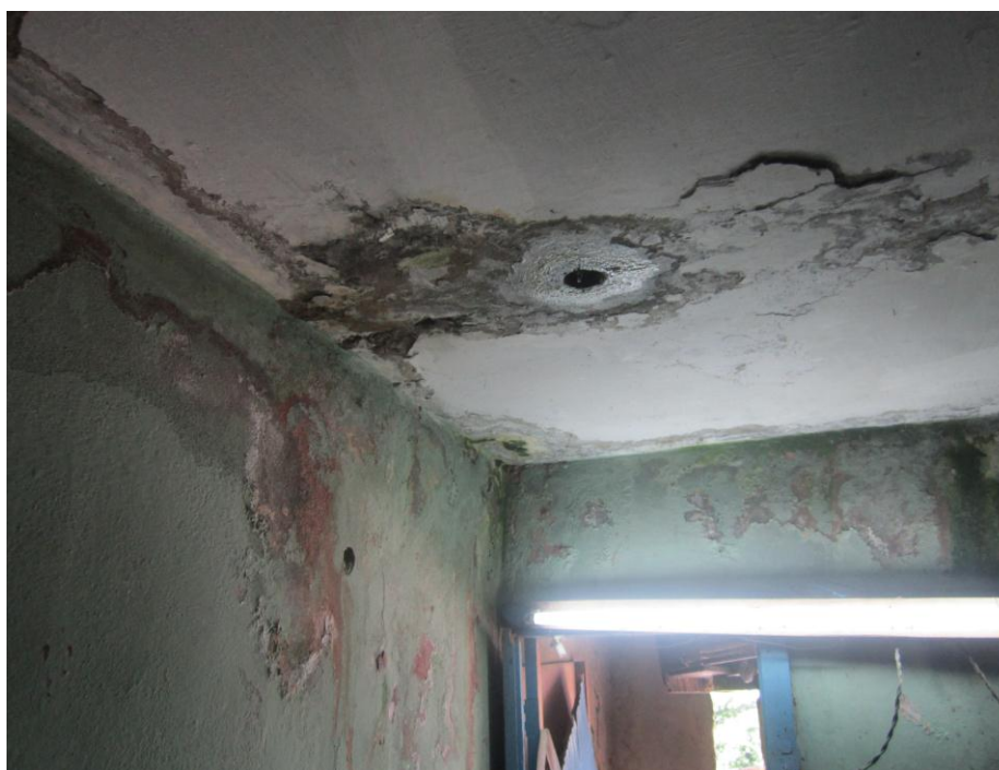
Área de la cocina de un apartamento del edificio.