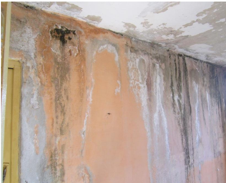
Pared exterior de un apartamento del edificio manchada por la filtración de agua

El municipio de Songo-La Maya exhibe una elevada tasa de deterioro habitacional en la provincia, aun cuando se han aplicado políticas populistas en los últimos años como la construcción de casas de bajo costo dentro de las llamadas Obras Sociales, con beneficios para algunos trabajadores, sobre todo que hayan cumplido misiones internacionalistas, o de entidades militares, algunas reparaciones, en zonas de viviendas como los edificios multifamiliares en La Maya, sin embargo, la situación sigue siendo crítica.